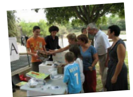
Participation à des festivals...