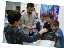
Installation de lombricomposteurs dans des écoles...