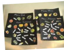
Des jeux sur les saisons et la localisation des fruits et légumes