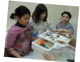
Les enfants s'essaient au jeu du lombricompostage