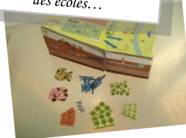
Des jeux sur les enjeux agricoles...