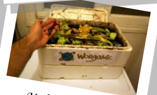
Modèle WorgaBox de Lombricomposteur